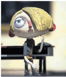
ESPOSIZIONE Un pupazzo utilizzato nel film d'animazione La mia vita da Zucchina di Claude Barras ora in mostra all'Espocentro. Sopra: il regista Maurizio Nichetti.

mo. D'altronde però il mondo è cambiato e il passato non è per forza migliore. Io amo stare con i giovani perché mi danno entusiasmo e rappresentano il futuro. Un consiglio che mi sento sempre di dare loro è di capire se vogliono lavorare nel mondo del cinema (di animazione e non) perché insegnano un sogno o perché sono alimentati dalla passione. Nel primo caso vuol dire che ci si vede proiettati verso il successo, ma c'è anche il rischio di andare incontro a delle delusioni. Nel secondo invece, la passione non ti abbandonerà mai e ti darà sempre la forza per andare avanti.».