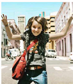
'Swing it Kids!'

gazzi) dei piccoli brividi di timore. Questi debbono però poi venir razionalizzati soprattutto quando, come oggi sempre più spesso accade, la fruizione è individuale e quindi ci sono meno occasioni per superare le eventuali tensioni create dalla visione di un film.