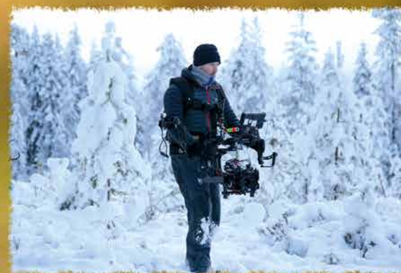
Propos recueillis par Joséphine Lebard

Les Finlandais eux-mêmes avaient perdu le lien avec cet animal. Raconter une histoire et toucher les gens, cela me semble permettre une prise de conscience moins culpabilisante.